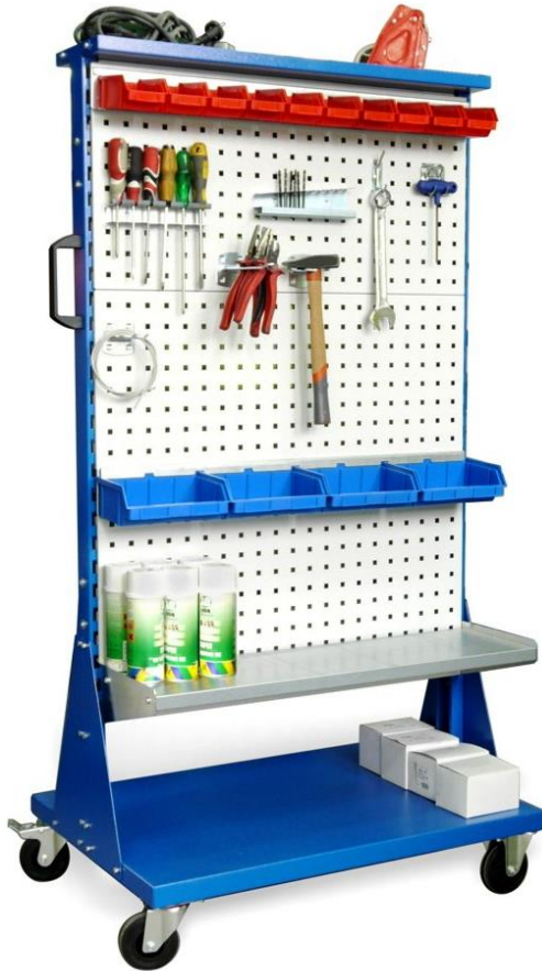
Przykładowa konfiguracja wózka