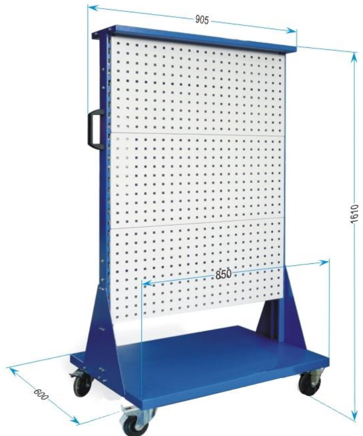
Wymiary gabarytowe wózka