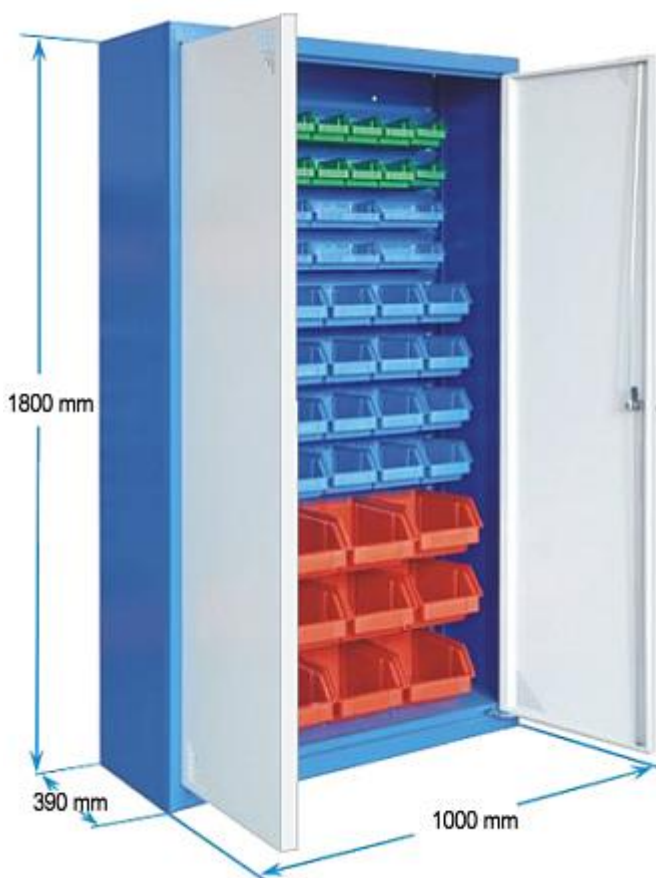
Szafa metalowa warsztatowa z pojemnikami