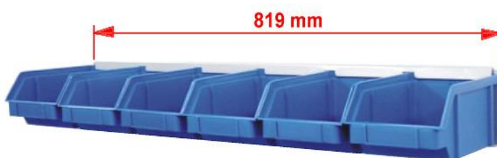
■ Pojemniki na listwie