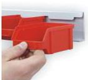
■ Zakładanie pojemnika