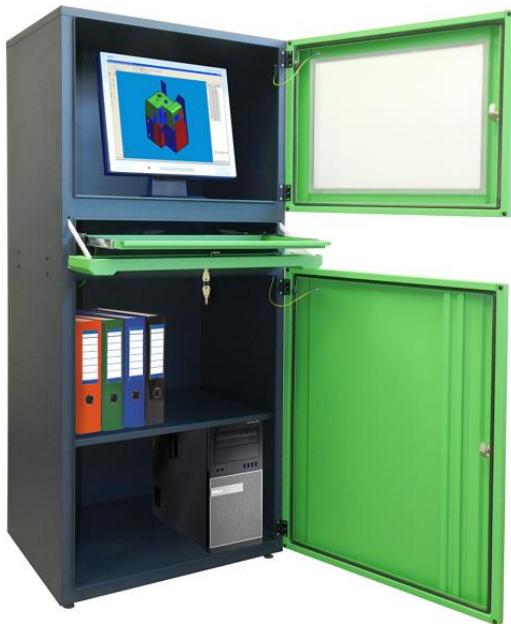
■ Wersja na stopkach