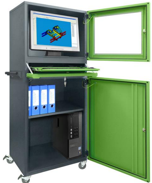
■ Wersja na kółkach z dodatkowym uchwytem