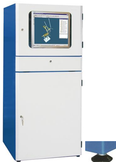
Szafa na komputer uniwersalna na stopkach