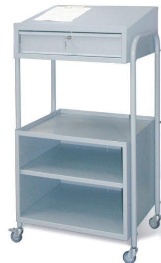
Pulpit warsztatowy z szafką otwartą, na stopkach